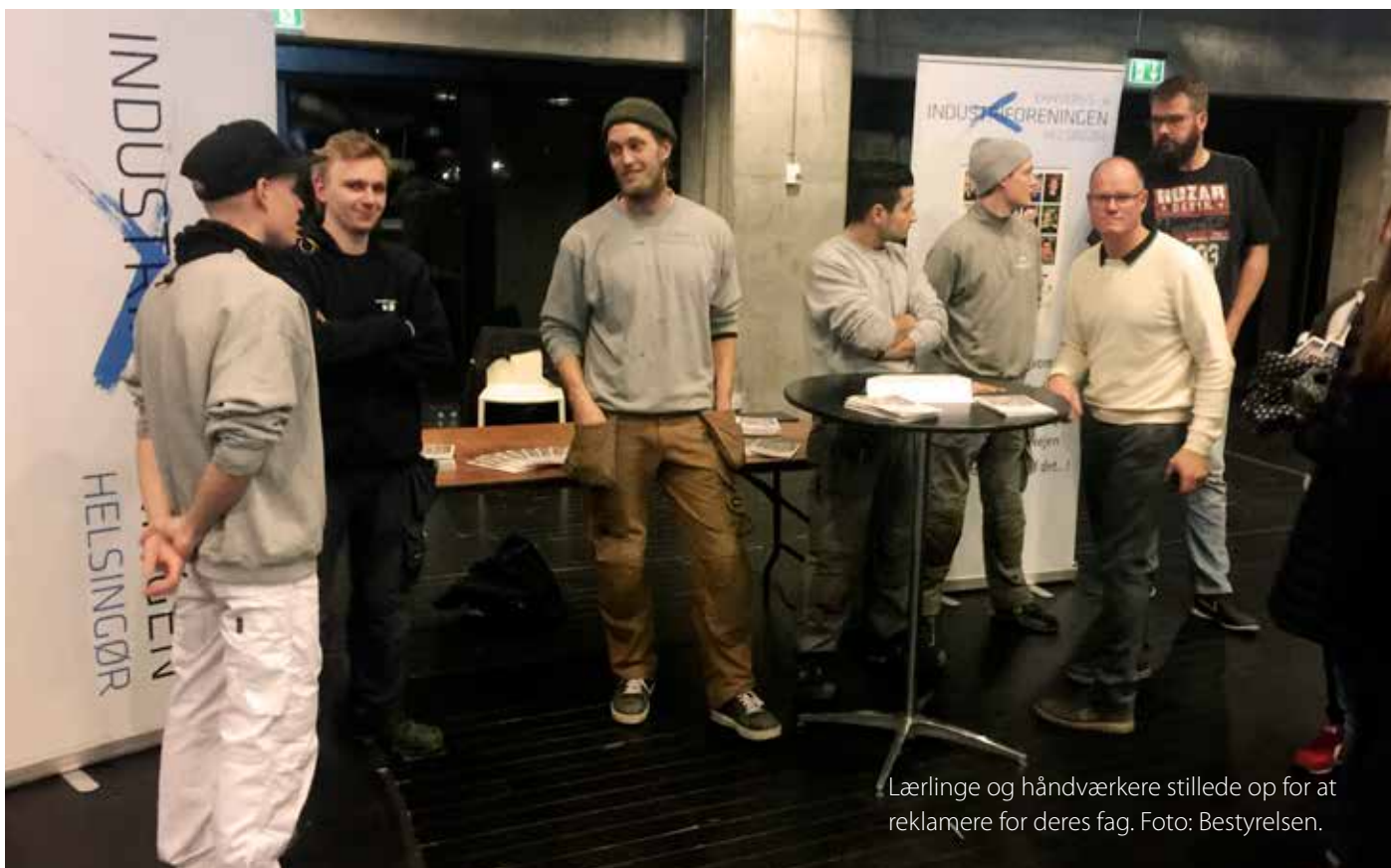
Lærlinge og håndværkere stillede op for at reklamere for deres fag.